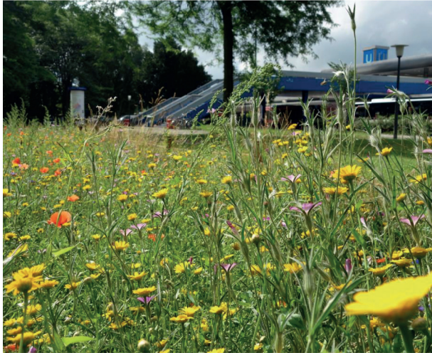
Wildblumenwiese an der U-Bahnhaltestelle Billstedt

Im April 2021 erfolgte die Anlage einer rund 600 m 2 großen Wildblumenwiese im nord-westlichen Bereich der Grünfläche Maukestieg nördlich des Bahnhofs Billstedt. Sie dient der Verbesserung des Stadtklimas und der Aufwertung des Haltestellenumfeldes.