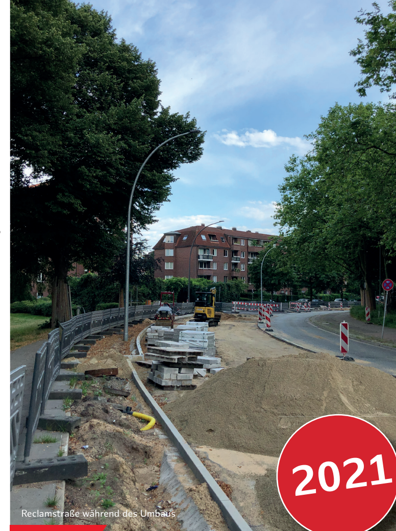
Reclamstraße während des Umbaus

Herausgeber: Bezirksamt Hamburg-Mitte - Fachamt Stadt- und Landschaftsplanung - Caffamacherreihe 1-3 - 20355 Hamburg - © Dezember 2021 Redaktionelle Bearbeitung und Gestaltung: plankontor Stadt & Gesellschaft GmbH / Fachamt Stadt- und Landschaftsplanung Bildnachweis: plankontor Stadt & Gesellschaft GmbH / Gesundheit für Billstedt/Horn UG / HVV GmbH - Druck: Scharlau GmbH - 1. Auflage: 1000