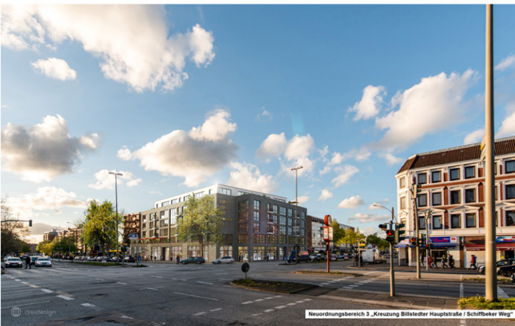
Neuordnungsbereich 3 „Kreuzung Billstedter Hauptstraße / Schiffbeker Weg“