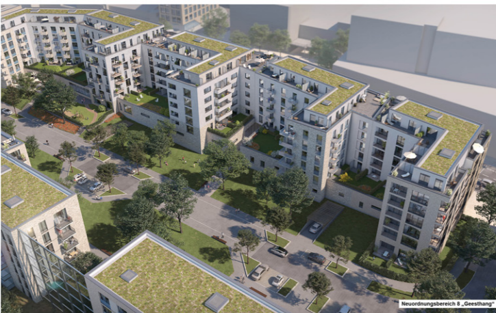
Neuordnungsbereich 8 „Geesthang“