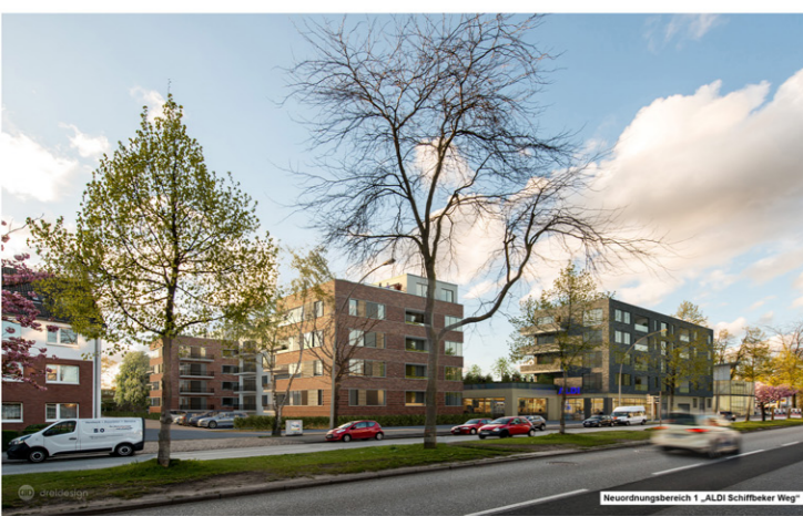
Neuordnungsbereich 1 „ALDI Schiffbeker Weg“