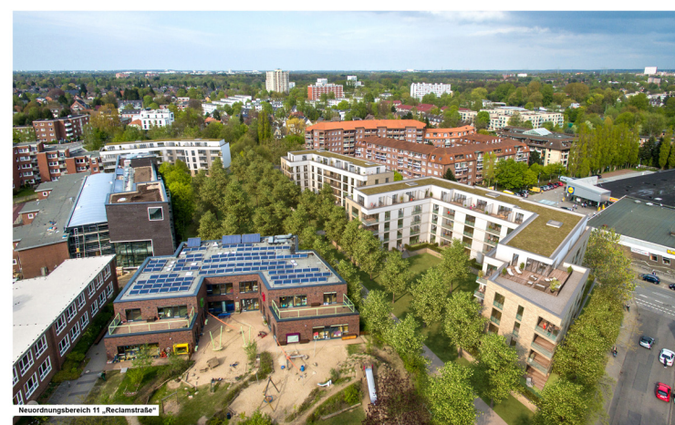
Neurungsbereich 11 „Reclamstraße“