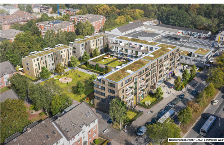
Neurungsbereich 1 „ALDI Schiffbek Weg“