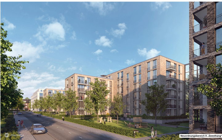
Neurungsbereich 8 „Geesthang“